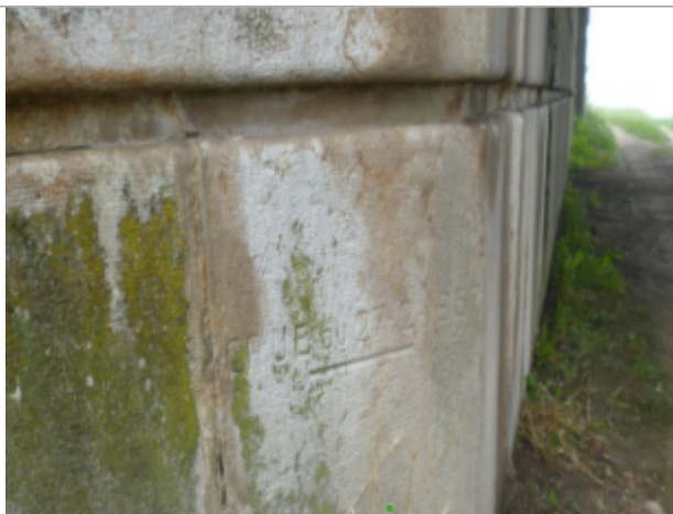
Vue du repère - Auteur : société Grontmij-Parera

Altitude calculée de l'eau (en m) : 60.982