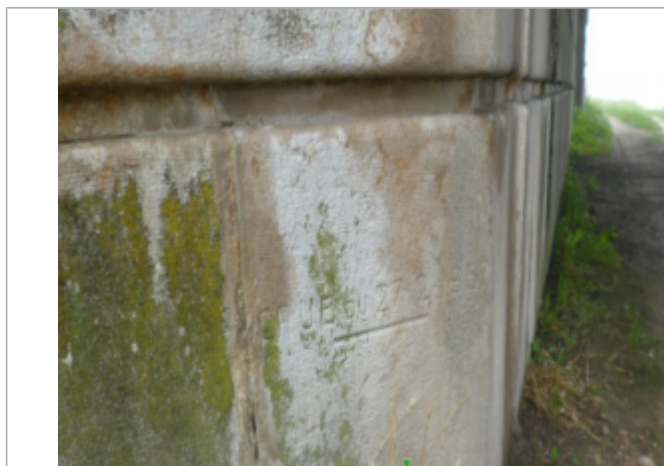
Vue du repère - Auteur : société Grontmij-Parera

Altitude calculée de l'eau (en m) : 60.982