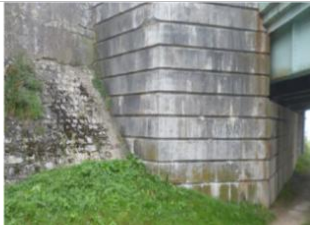
Vue du site - Auteur : société Grontmij-Parera