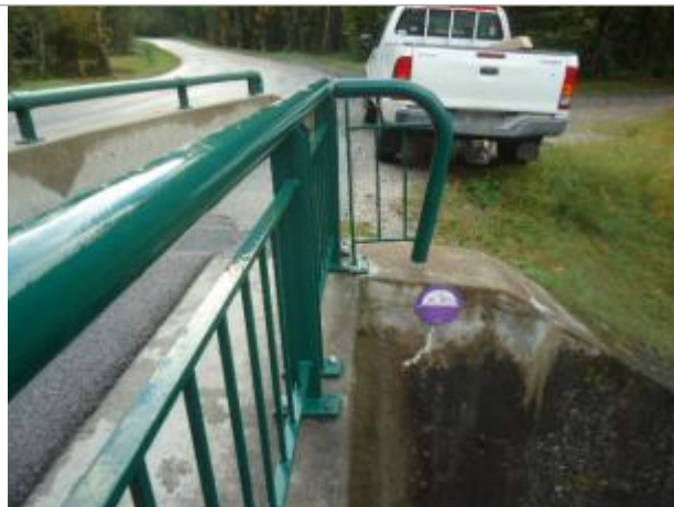
Pont de l'eau rouge