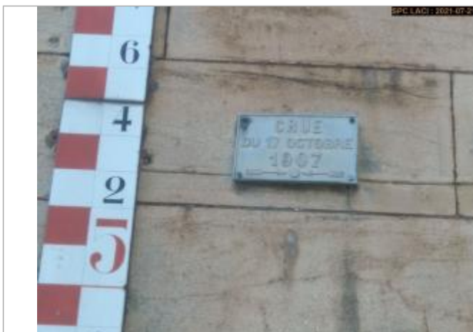
Plaque du repère à proximité de l'échelle du pont du Coteau