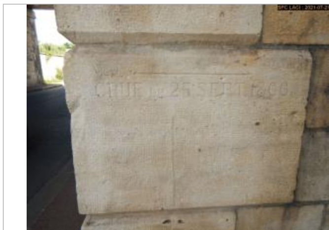
Sur l'hauteur de la pierre à 1.25 mètres au dessus du sol à droite de la chaussée

Altitude calculée de l'eau (en m) : 273.2 m