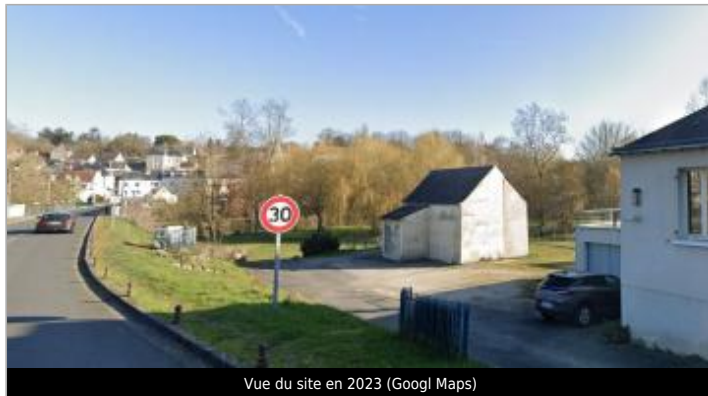
Vue du site en 2023