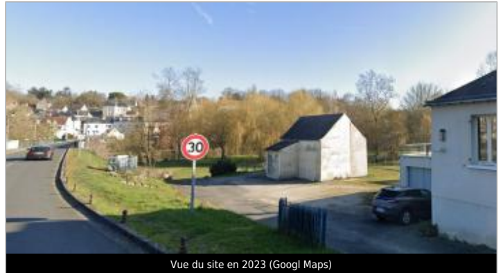
Vue du site en 2023

Coordonnées WGS84 : X: 0.87620936 / Y: 47.24841460