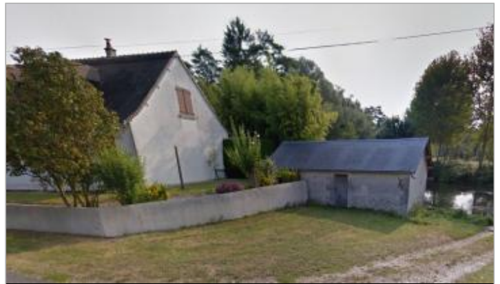
Vue depuis la route du lavoir supposé