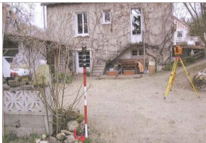
Vue du repère en 2010

Altitude calculée de l'eau (en m) : 51.14 m