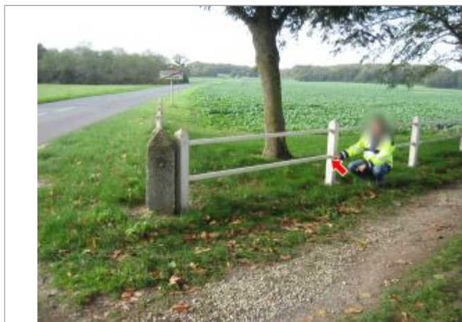
Photo du recensement d'origine (2014)