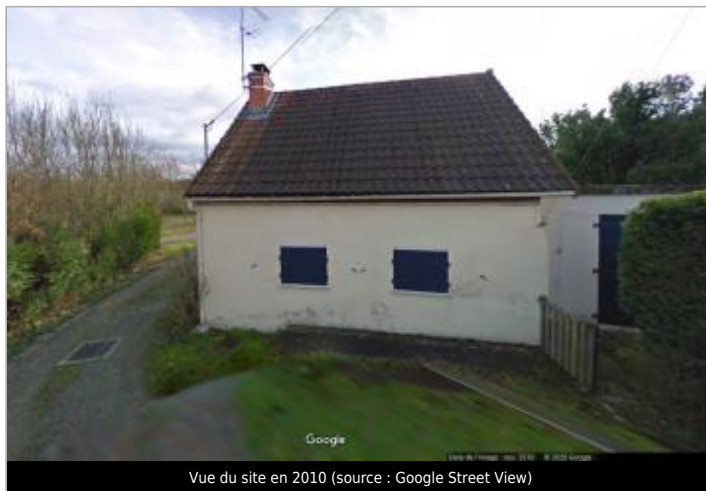
Vue du site en 2010