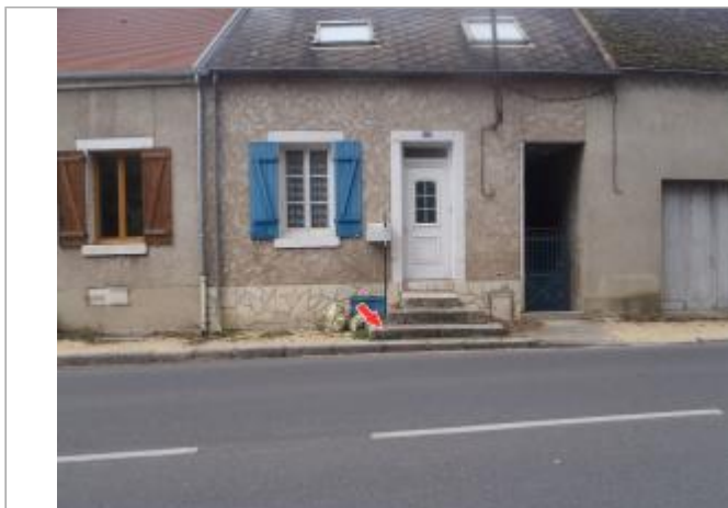
Vue du site en 2014, avec le repère de janvier 1976