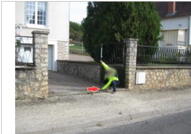
Vue du site en 2014