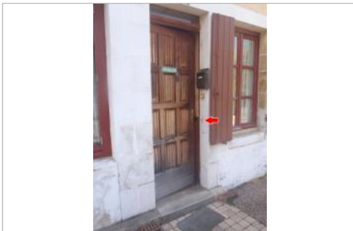
Vue du site en 2014