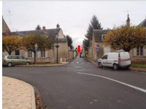
Vue du site en 2014