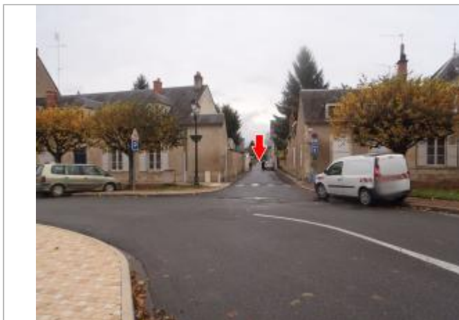
Vue du site en 2014