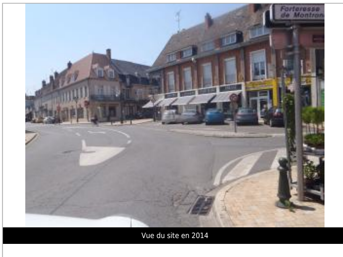
Vue du site en 2014