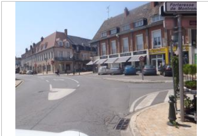
Vue du site en 2014