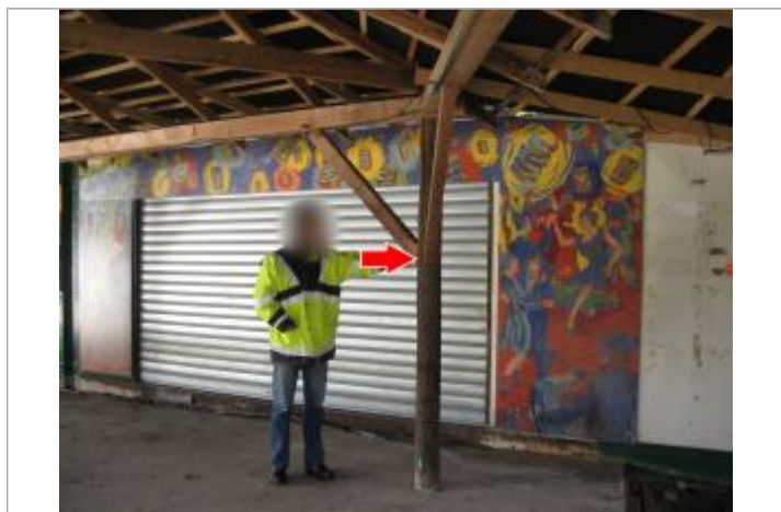
Vue du repère en 2014

Code : LCI_R_4357_6860 Date de mise à jour : 09/01/2023 Auteur : SPC LCI