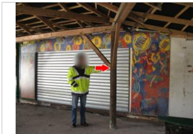
Vue du repère en 2014