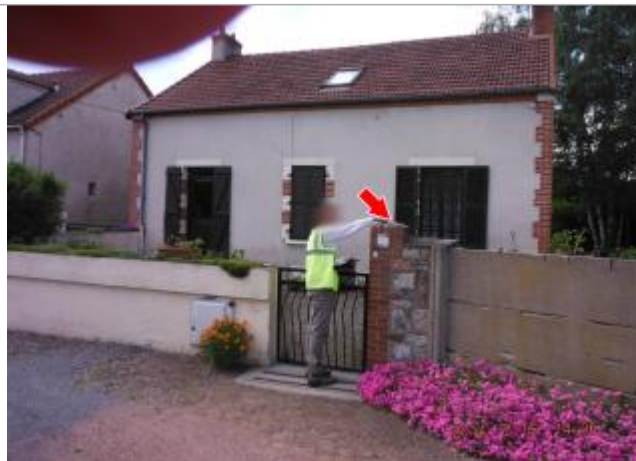
Vue du site en 2014