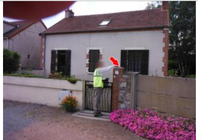
Vue du site en 2014

Coordonnées WGS84 : X: 2.59930210 / Y: 46.36210200