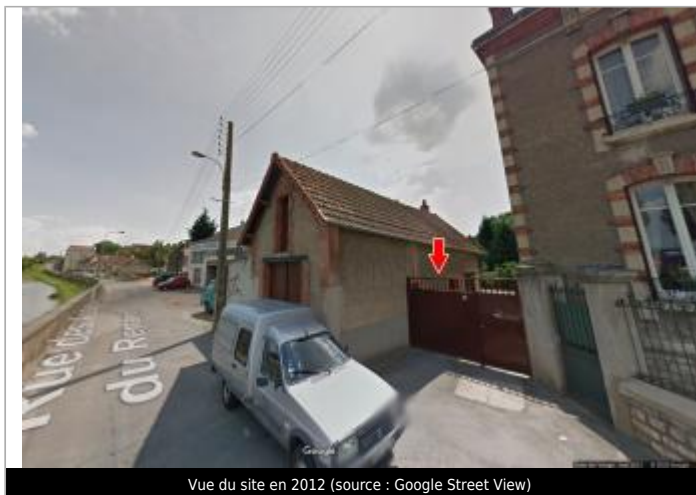
Vue du site en 2012