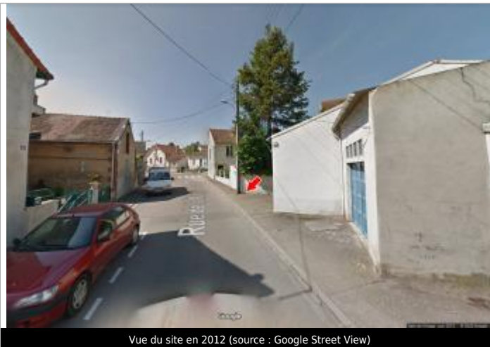
Vue du site en 2012