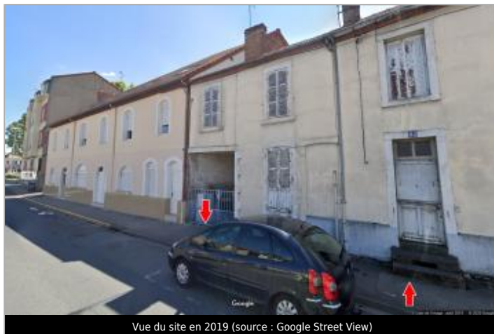
Vue du site en 2019