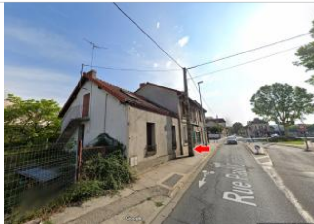
Vue du site en 2019