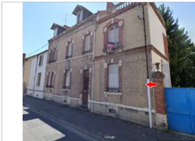
Vue du site en 2019