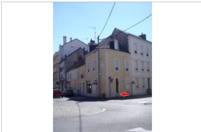
Vue du site en 2014