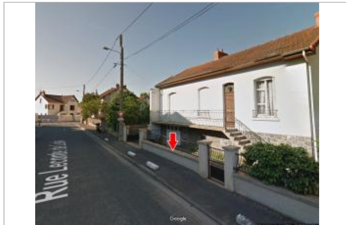
Vue du site en 2012