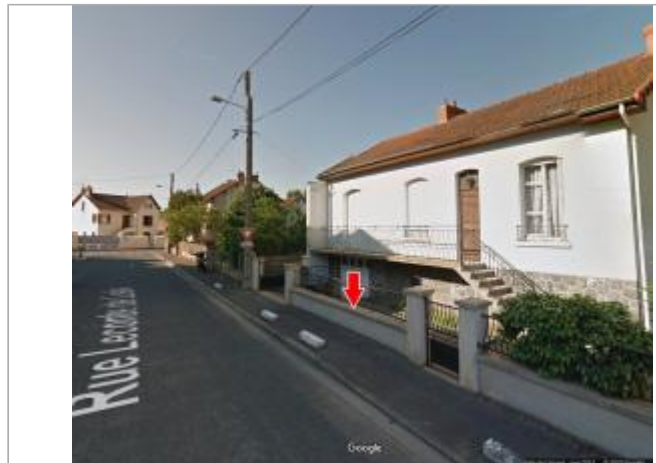
Vue du site en 2012

Coordonnées WGS84 : X: 2.59360950 / Y: 46.33526600