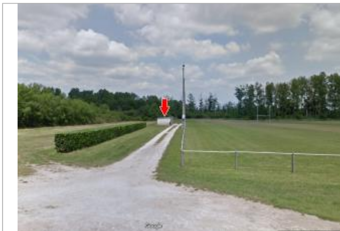
Vue du site en 2013

Coordonnées WGS84 : X: 2.26318180 / Y: 46.93961900