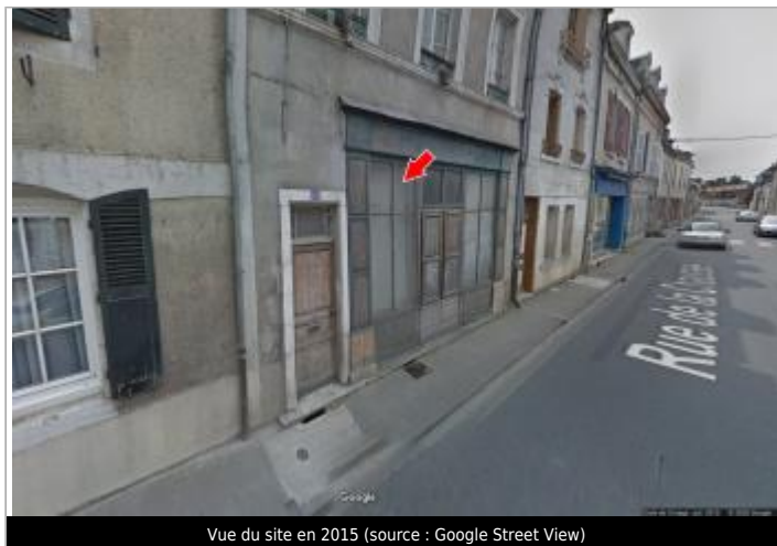
Vue du site en 2015