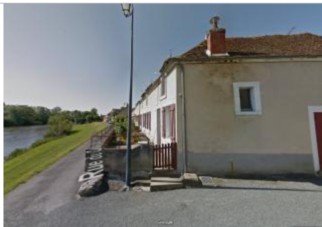
Vue du site en 2013