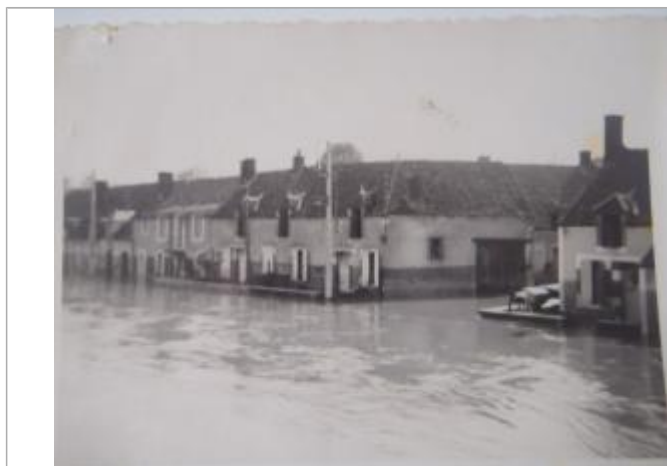
Photographie d'archive de 1940

Altitude calculée de l'eau (en m) : 138.8 m