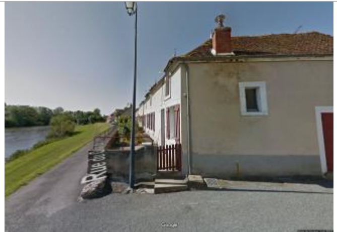
Vue du site en 2013 (source : Google Street View)

Coordonnées WGS84 : X: 2.31278390 / Y: 46.85670200