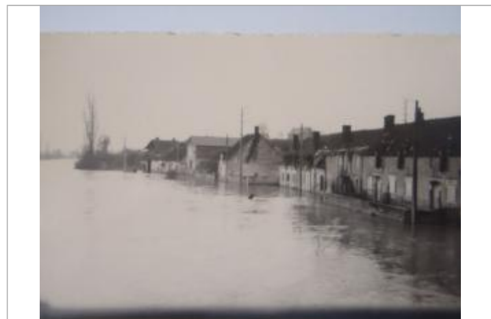
Photographie d'archive de 1958

GÉNÉRAL Code : LCI_R_4200_6607 Date de mise à jour : 09/01/2023 Auteur : SPC LCI