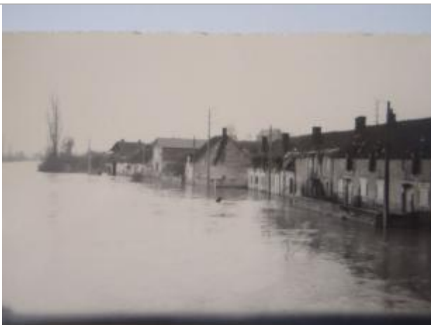
Photographie d'archive de 1958

Altitude calculée de l'eau (en m) : 138.23 m