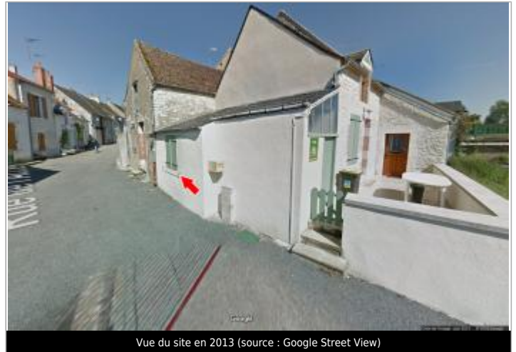
Vue du site en 2013

Coordonnées WGS84 : X: 2.31275660 / Y: 46.85678300