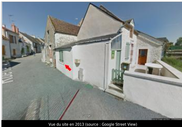
Vue du site en 2013