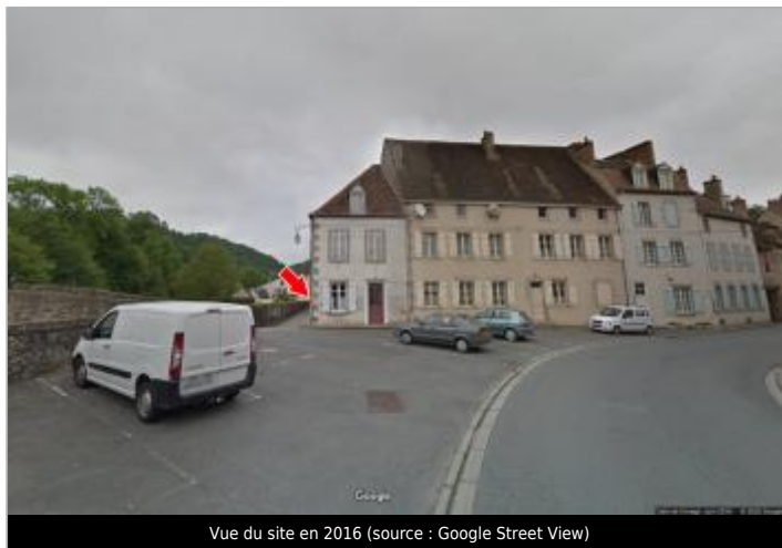
Vue du site en 2016