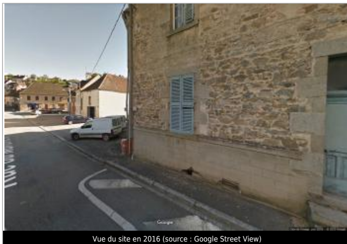
Vue du site en 2016