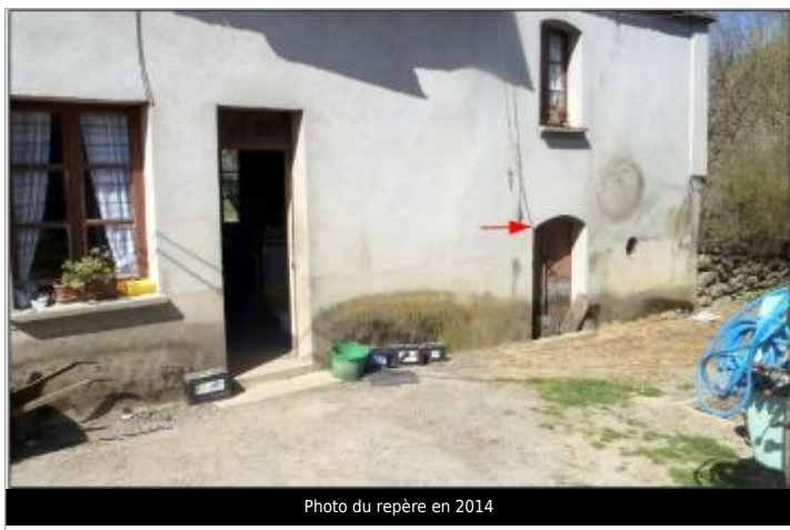
Photo du repère en 2014