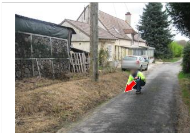
Photo du repère en 2014