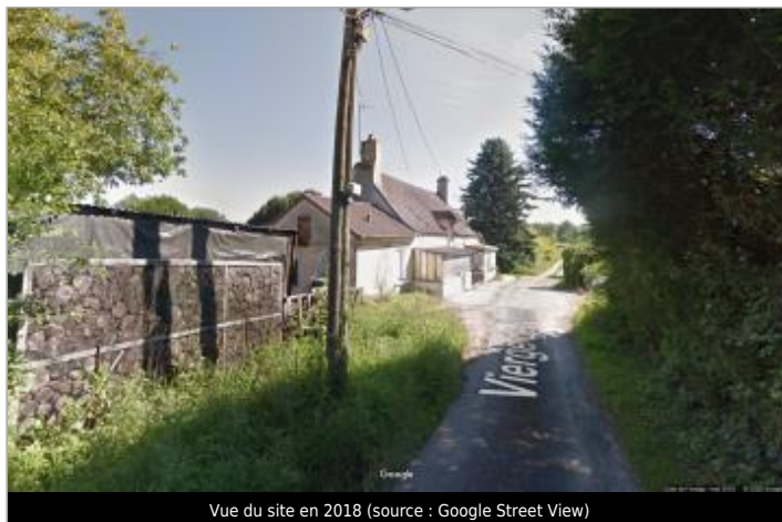
Vue du site en 2018