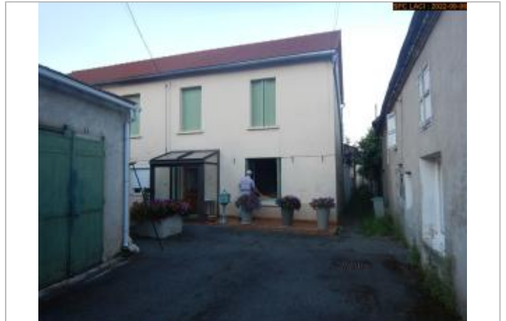
Vue du site éloignée (à partir de l'impasse)

Coordonnées WGS84 : X: 3.09215542 / Y: 46.11628538