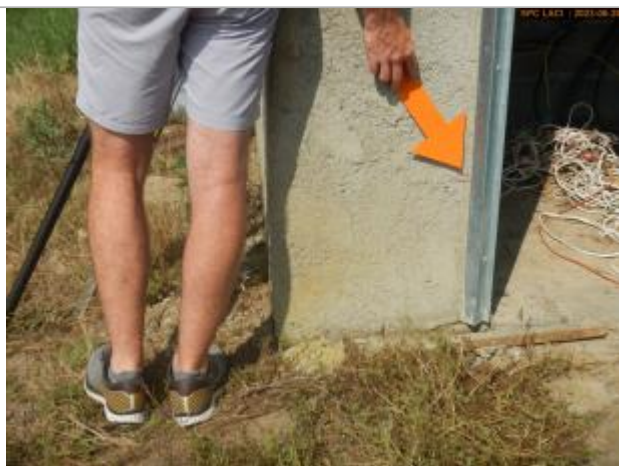
Vue du repère en 2023

Altitude calculée de l'eau (en m) : 242.363 m