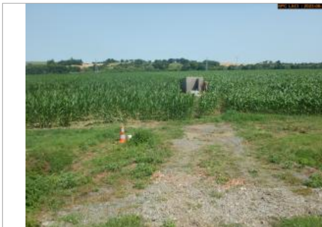
Vue du site en 2023

Coordonnées WGS84 : X: 3.40781710 / Y: 46.22671560