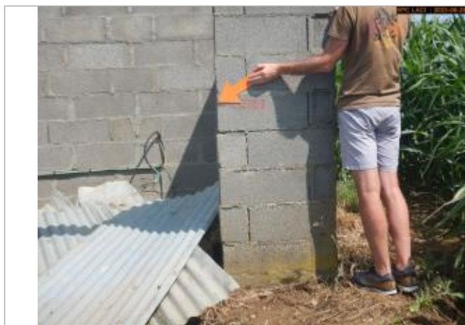
Vue du repère en 2023