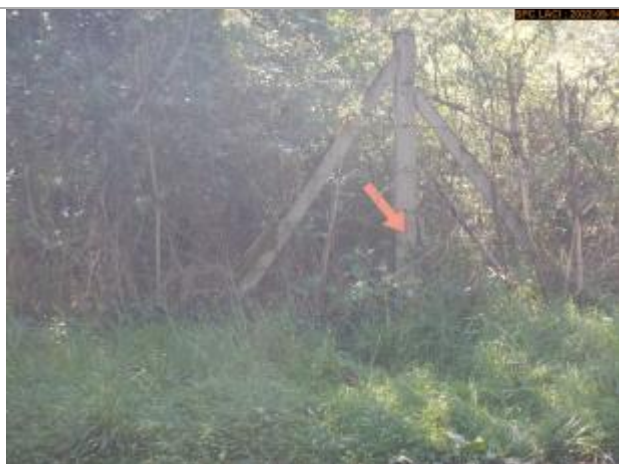
Vue du repère éloignée (poteau)

Altitude calculée de l'eau (en m) : 253.85 m