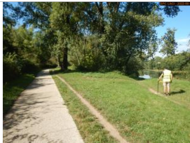
Vue du site éloignée (berge)