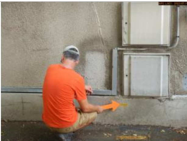
Vue du repère en 2023

Altitude calculée de l'eau (en m) : 374.116 m