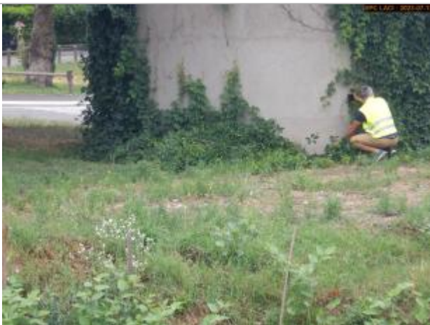
Vue du repère en 2023

Altitude calculée de l'eau (en m) : 332.122 m