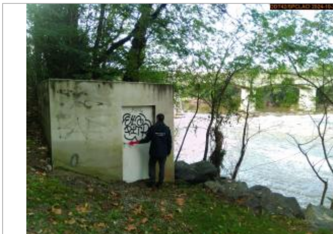
Vue du site en 2024, avec le repère de la crue du 17 octobre 2024

Coordonnées WGS84 : X: 4.27189430 / Y: 45.56358860