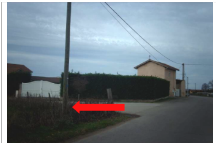
Photo du site et du repère de la crue de 2008

GÉOLOCALISATION Coordonnées WGS84 : X: 4.29193300 / Y: 45.64501740 Coordonnées RGF93 (Lambert 93) X: 800627 / Y: 6505876 Coordonnées RGF93 (ETRS89) : X: 4.291933 / Y: 45.6450174 Code Hydro: K0684200 Rive de référence: Non renseigné