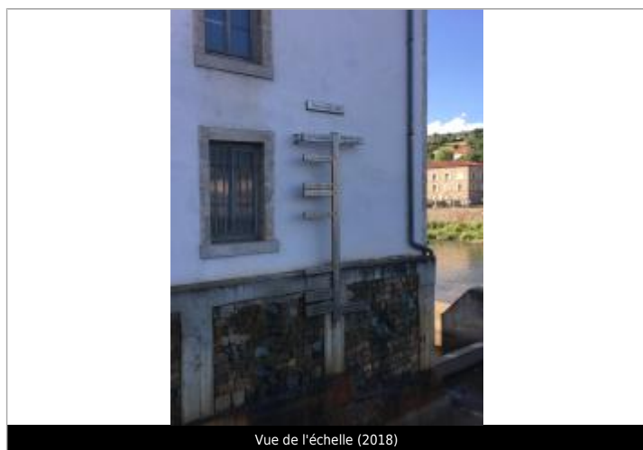
Vue de l'échelle (2018)