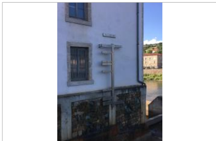
Vue de l'échelle (2018)