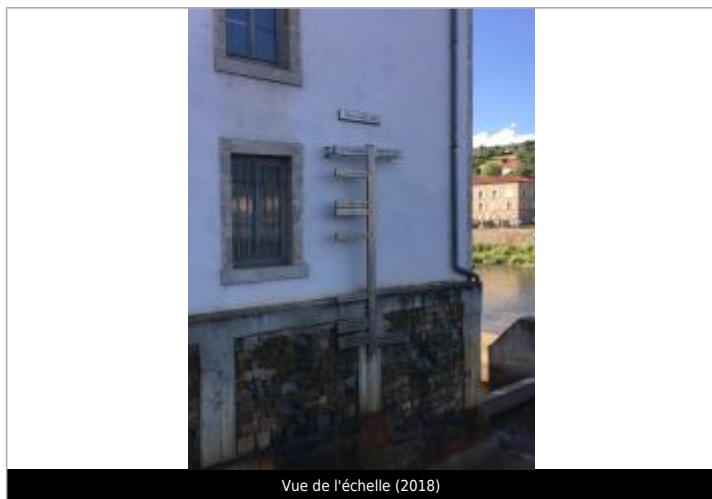
Vue de l'échelle (2018)