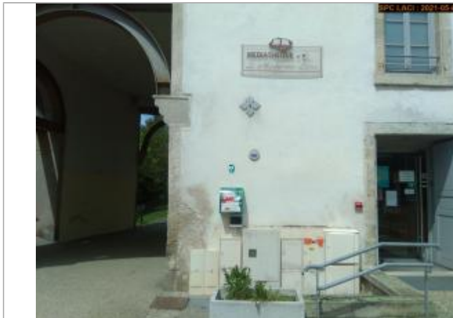
Vue du site en 2021