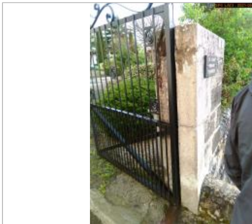
Vue du site en 2021