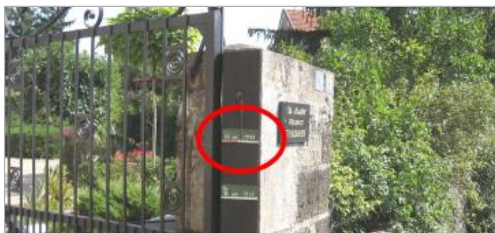
Vue du repère rapprochée en 2008