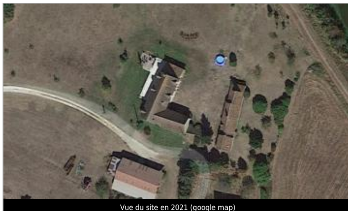
Vue du site en 2021 (google map)