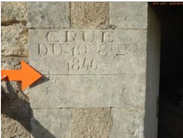
Vue du repère éloignée

Altitude calculée de l'eau (en m) : 159.327 m