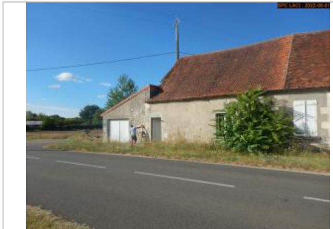
Vue du site éloignée

Coordonnées WGS84 : X: 2.98978496 / Y: 47.19267069