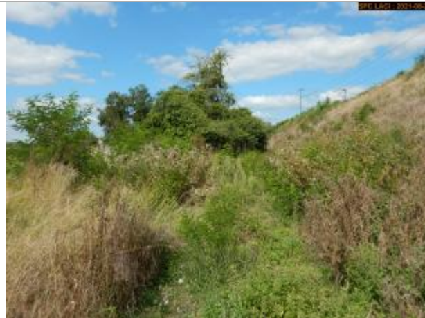
Vue du chemin vers le site en 2021