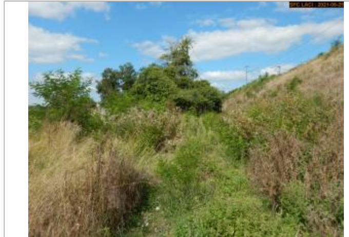
Vue du chemin vers le site en 2021