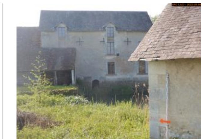
Vue du repère en 2022