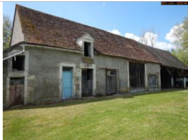
Vue du site en 2022